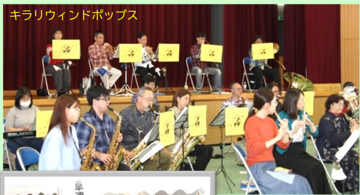
キラリウィンドポップス