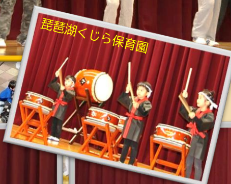
琵琶湖くじら保育園