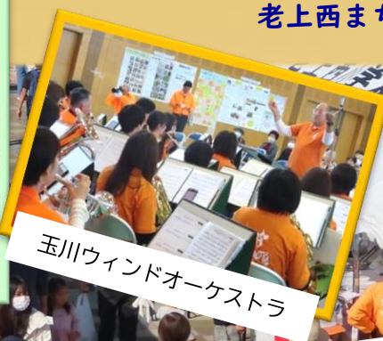
玉川ウィンドオーケストラ