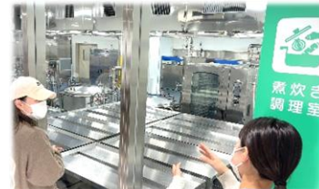
草津市第二中学校給食センター