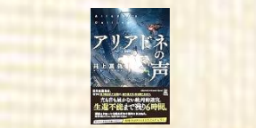
辻 大吾校長 『アリアドネの声』 井上 真偽