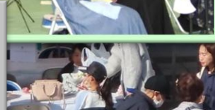
野洲高校 ダンス部