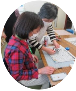
体験で“しおり”づくり