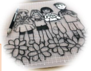
紙芝居サロンメンバーは新作制作中