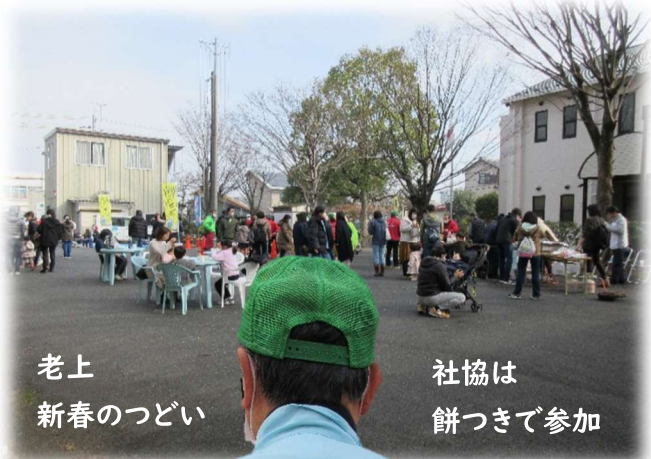
老上 新春のつどい