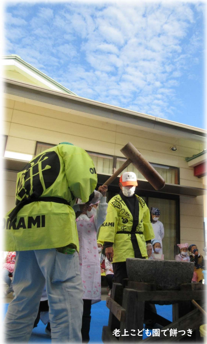
老上こども園で餅つき

2022年度はコロナウイルスのニュースが続く 中で、中断していた行事が、再開されていきまし た。感染対策や新たな工夫を加えて、人が集まる 場が増えてきました。