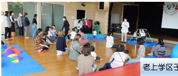
老上学区子育てサロン