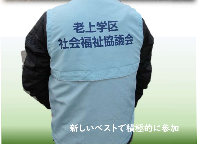
新しいベストで積極的に参加