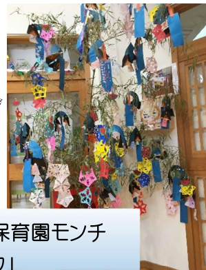
くさつ優愛保育園モンチ 「七夕」