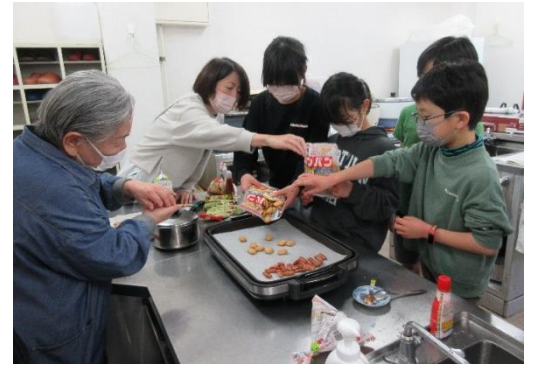
☆子ども記者にもカンパンピザ、大好評☆