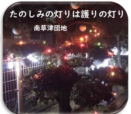
たのしみの灯りは護りの灯り 南草津団地

湖州平南公園では毎年町内有志の方々によるクリスマスイルミネーションがライトアップされます。子どもたちが笑顔で集ってくれる感動から年々寄贈や自治会の協力もあり華やかさが増し、たくさんの方が公園に集まりクリスマスシーズを楽しんでいます。思いやりの気持ちから生まれた素敵なプレゼントのバトンがこれからもずっとつながっていきますように。