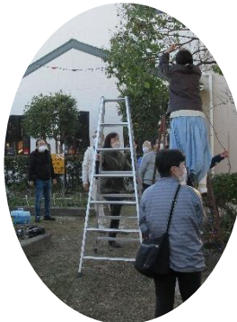
多くの手で準備 (まちづくりセンター)