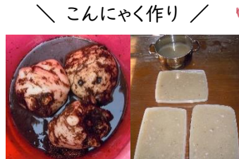
＼ こんにやく作り ／

芋をたわしで洗い、ゆで、つぶし、水酸化カルシウムを入れ、さらにゆでて、あくを抜く。まずい。思いっきりまずかった。(Y.T.)