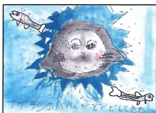
④アザラシのバイクんがとびだしてきた