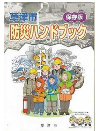
ハンドブックは老上まちセンにあります

そして、老上地域の災害発生時の備えはどのようになっているのか?現状の問題点やこれからの課題を整理して、安心安全に暮らせる老上のまちづくりに繋げて行きます。