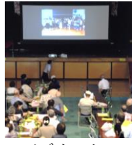
ビデオレター (老上小学生)