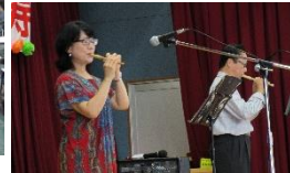
よし笛 (レイクリード)