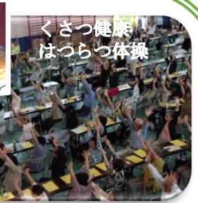
くさつ健康！はつらつ体操