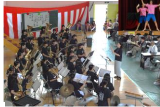
吹奏楽と生徒会 (老上中学生)