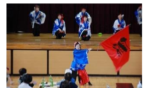
よさこい元気舞隊