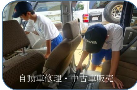
自動車修理・中古車販売