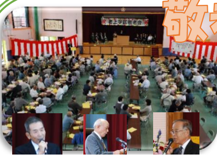
左から畑中まち協会長、畑老ク連副会長、山本社協会長