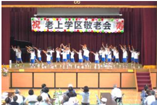
ダンス (老上幼稚園児)