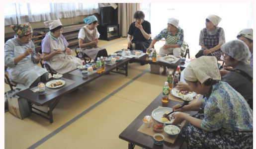
みんなで楽しくいただきます〜す