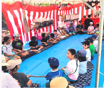
神妙な面持ちで大きな数珠回し