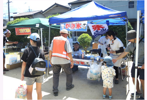
かき氷やフランクフルトもあるよ