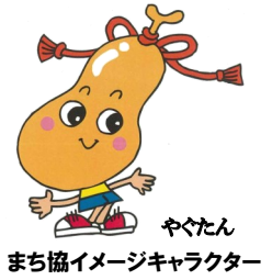
やくたん まち協イメージキャラクター