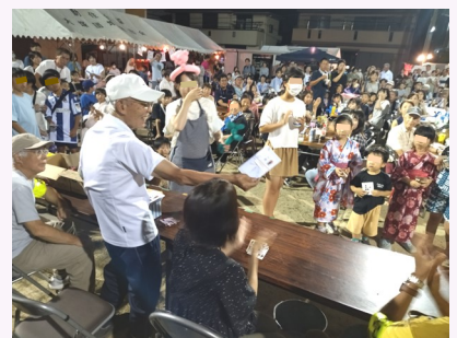
ビンゴゲームに380人が参加

上記の2町内と玄甫町が夏まつりを開催。また、恒例の地蔵盆が、猛暑にも負けず、各地域で執り行われました（矢倉町・室木町・東室木町・中尾町）