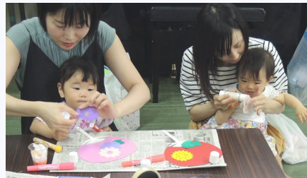
うちわにデコレーション