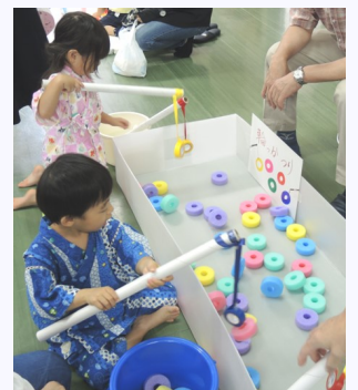
いくつ釣れるかな?