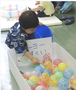
上手にすくえるかな?