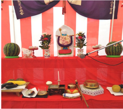
お地蔵さんにはお化粧も

今年の地蔵祈願は、願行寺のご住職にお勤めをしていただき、たくさんのお子どもたちによる「数珠回し」も、6年振りに復活し、厳かな中にも活気あるものとなりました。また、太鼓やよさこい体験も盛り上がり、かき氷やフランクフルトをみんなで食べたり、輪投げや、スーパーボールすくいをしたりと、笑顔いっぱいの日になりました。