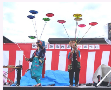
芸達者の皆さんがご披露