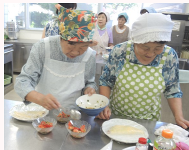
混ぜるだけって簡単やね