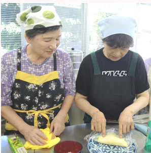
ラップごと折りたたむんよ

*次回は、10/26(土): あなたも是非参加してみませんか? (4Pに掲載のメニューを作ります)