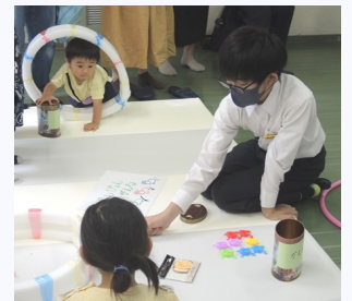
こうやって飛ばすんだよ