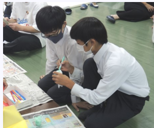
かき氷を作ります