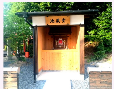
新築になったお堂のお地蔵様