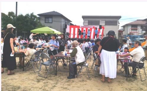
懐かしい顔や久しぶりの顔も