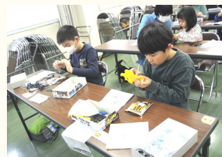
真剣なまなざしで取り組み中!

少しの時間でしたが、この様に親子で協力して、ひとつの物事に取り組む事の大切さを、改めて感じました。