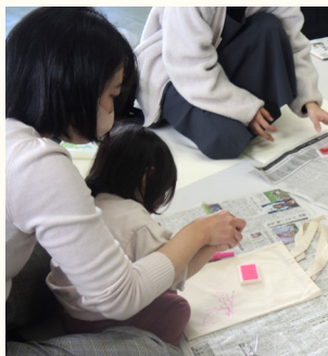
スタンプぺったん!