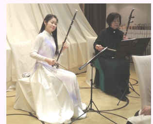
二胡奏者のお二人