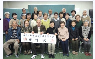
卒業生の皆様 おめでとうございます