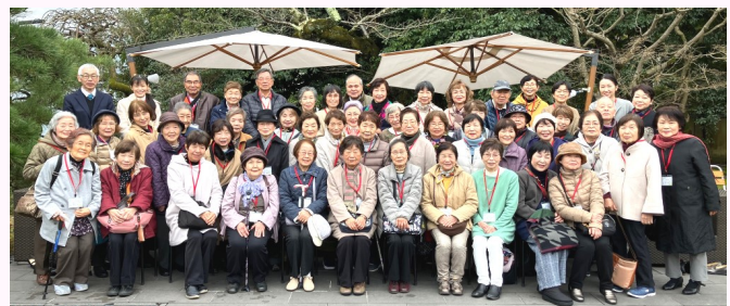
FURIAN山ノ上迎賓館にて、みんな揃って、はいポーズ♪