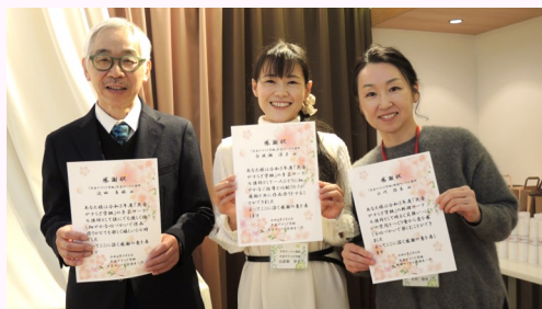
サークル講師の方々にも感謝状