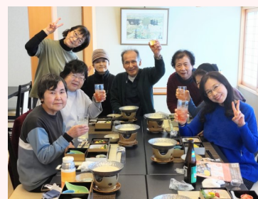
親睦会で盛り上がり♪