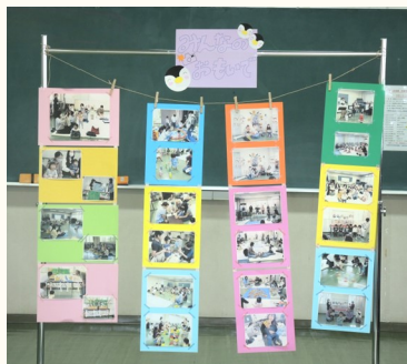
思い出の写真も展示