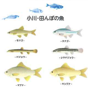
小川・田んぼの魚