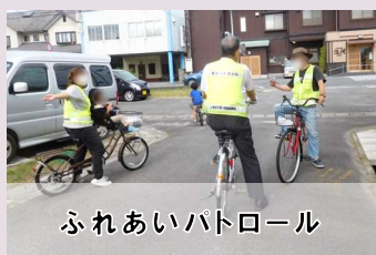
ふれあいパトロール