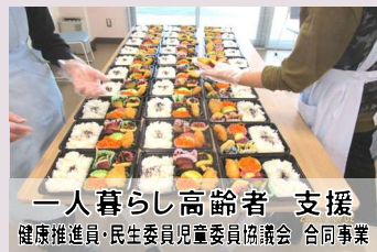
一人暮らし高齢者 支援 健康推進員・民生委員児童委員協議会 合同事業