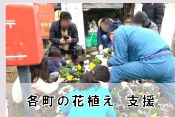
各町の花植え 支援