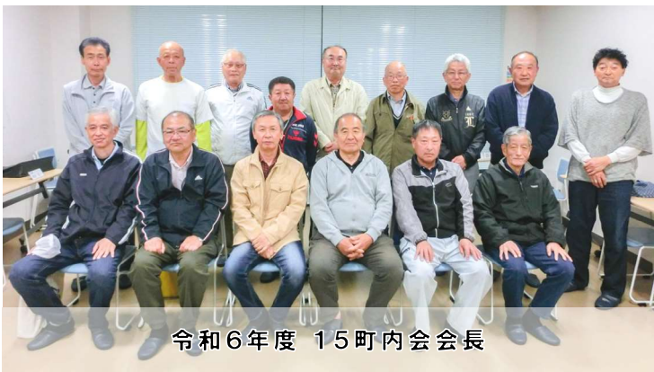
令和6年度 15町内会会長