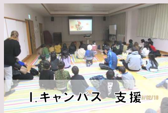
1. キャンパス 支援