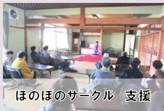
ほのほのサークル 支援