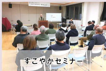
すこやかセミナー