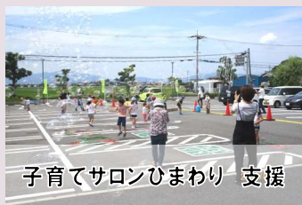
子育てサロンひまわり 支援