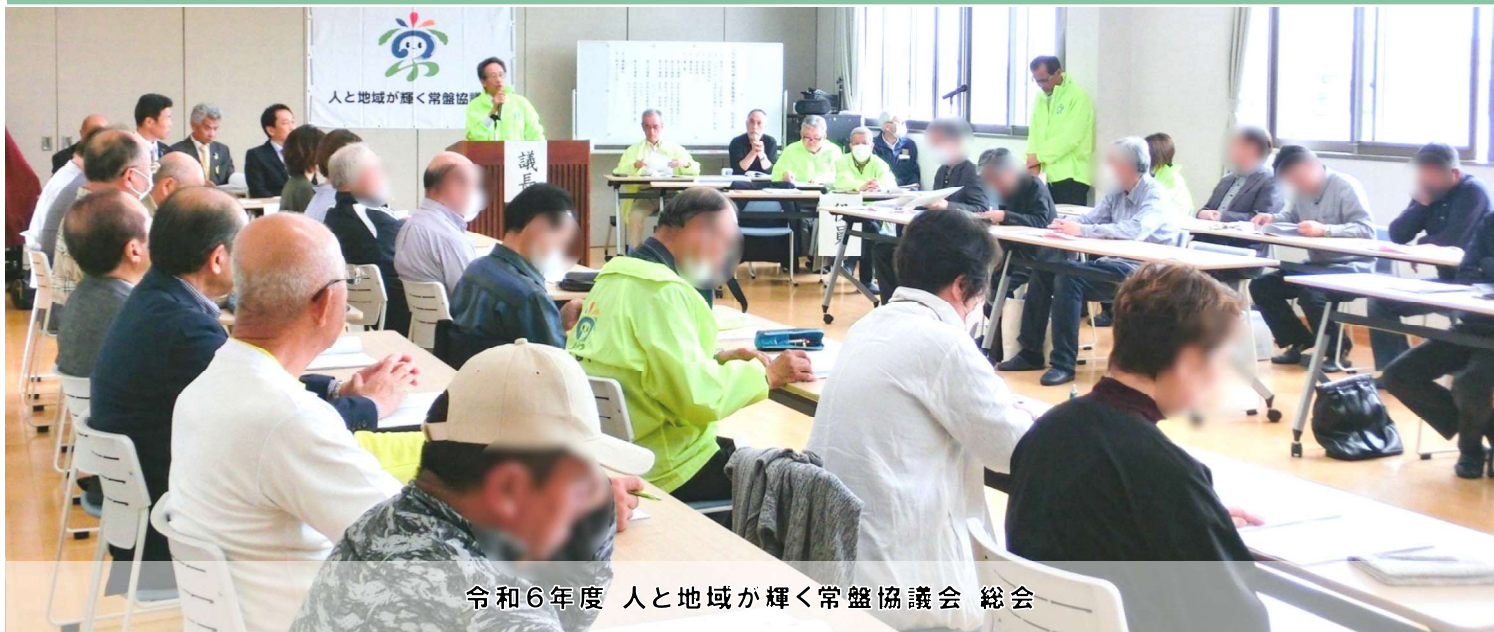
令和6年度 人と地域が輝く常盤協議会 総会

いつまでも住み続けたいと願う 「ふるさと常盤」を 地域のみなさまと共にめざします。