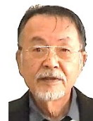
令和6年度老上西学区 まちづくり協議会役員(敬称略)