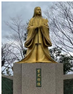
≪福井県 越前市にて≫