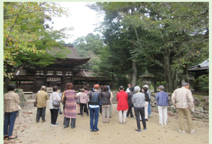
油日神社宮司様の話を熱心に聴く学級生

最初の訪問先、甲賀の櫛野寺には像高が3メートルを超えるご本尊の十一面観音座像が秘仏としてまつられていますが、この日は特別に公開していただきました。そこから1キロほどの油日神社は、昨今、多くの映画撮影が行われており、宮司様からは甲賀武士などの歴史に加え撮影エピソードなどもうかがいました。その後昼食を挟んで甲賀市くすり学習館、土山歴史資料館で地域の歴史を学びました。また、この日の昼食は薬膳料理で、効用が書かれた献立を見ながら皆さん楽しい時間を過ごされました。