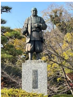
≪愛知県 岡崎城にて≫

毎回感じるのは、大河主人公がまちおこしの担い手になっていること。来年は大津市の石山寺がにぎやかになりそうです。いつかは草津に縁ある大河主人公が登場するといいな!(Y)