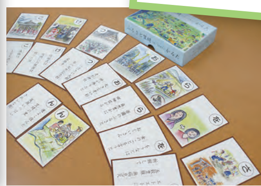
ふるさと笠縫かるた